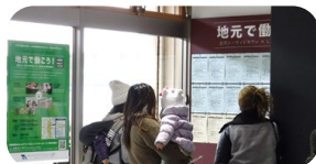
住宅地商店街への求人情報掲示