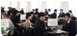
関東学院大合同企業面接会