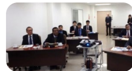
バングラデシュ経済特区長官来訪