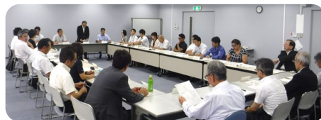
LINKAI横浜金沢活性化推進会議

また、年2回横浜市経済局、金沢区及び産業団地の団体代表者が一堂に会して「LINKAI横浜金沢活性化推進会議」が開催され、活動の方針について検討されております。