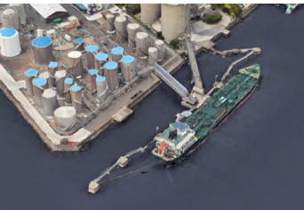
鳥浜港工業団地 右図②