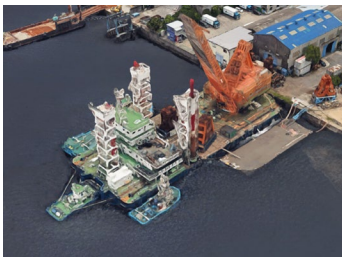
鳥浜港工業団地 右図①

特別工業地域に指定されていない地域は、「横浜港臨港地区内の分区における構築物の規制に関する条例」により、各分区の目的に合わない構築物の建設や用途の変更が禁止されている。